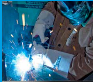
GRUNDLAGEN DES MIG / MAG SCHWEISSENS TEIL 1