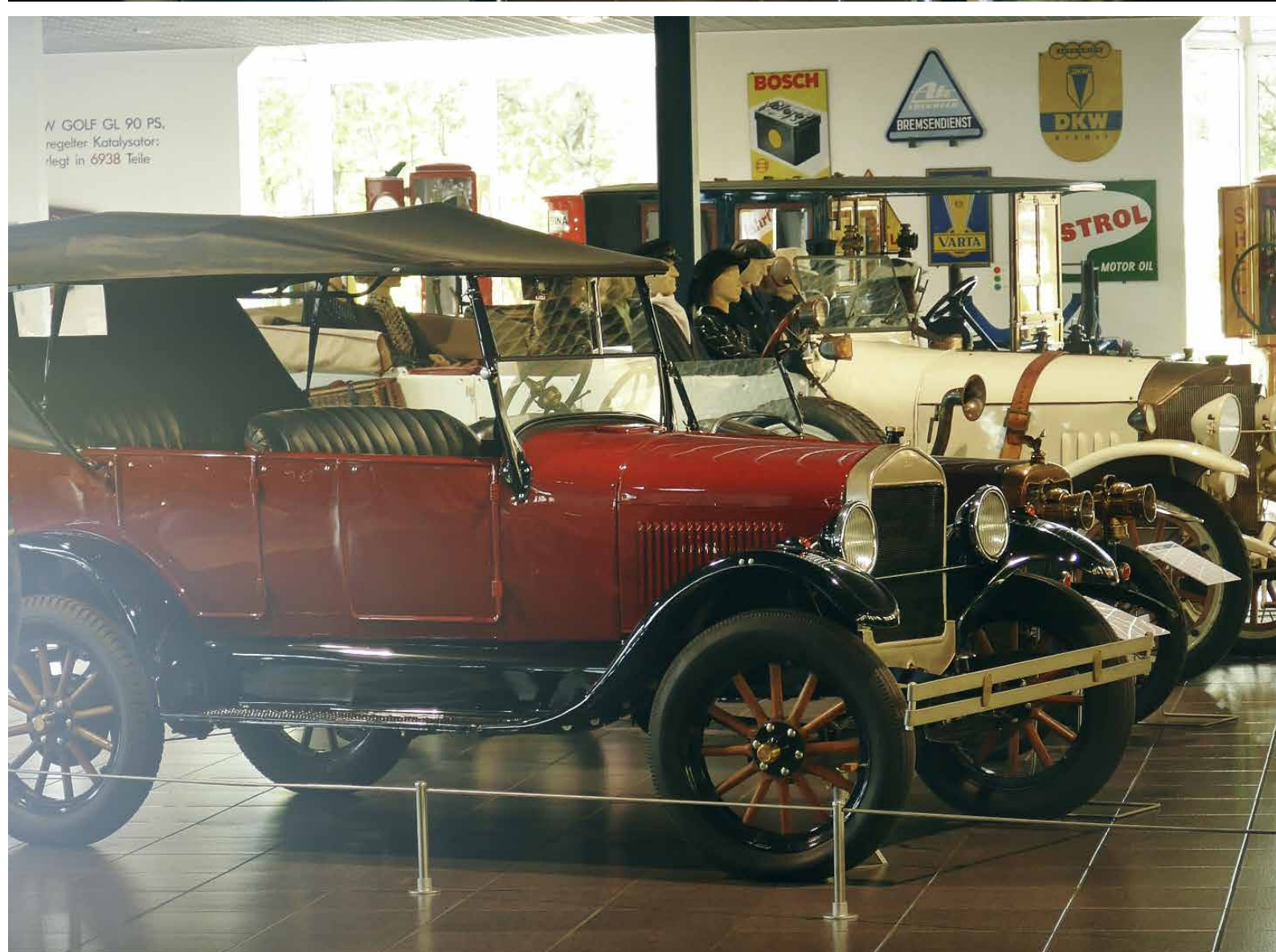
VW GOLF GL 90 PS, regelter Katalysator: liegt in 6938 Teile.