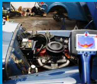
GRUNDLAGEN DER MOTOR INSTANDSETZUNG TEIL 2