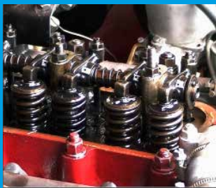
GRUNDLAGEN DER MOTOR INSTANDSETZUNG TEIL 1

Unsere Technik und Know How DVD Editionen erhalten Sie auf Amazon.de oder in unserem www.hangar44.de/shop . Die DVDs zeigen praktische Anwendungstipps und geben Hilfestellungen im Bereich Technik, Blecharbeiten und Schweißen.