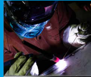
GRUNDLAGEN DES WIG-SCHWEISSENS